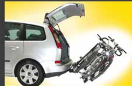
aluline smiley In abgeklappter Position