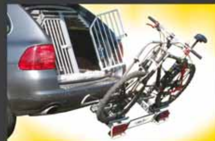
Zugang zum Kofferraum auch mit Fahrräder möglich.