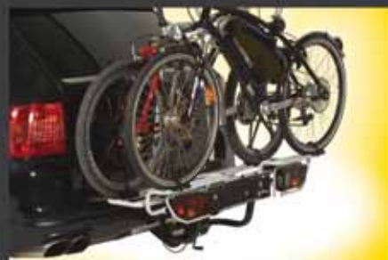
multi-cargo2-x-country für 3 Fahrräder Bestell.-Nr. 7300 (bestehend aus 7200 und 8333).