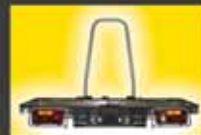
Plattformträger Bestell.-Nr. 8498 Komplett. Der Umbau vom Plattformträger bis zum Fahrradträger ist problemlos.