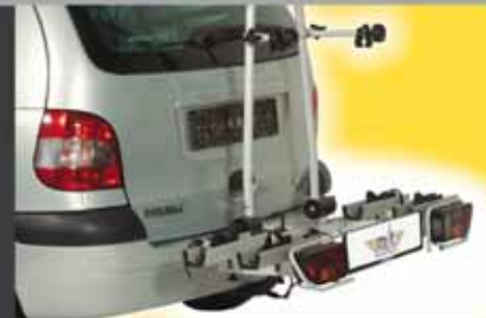
aluline smiley für 2 Fahrräder Bestell.-Nr. 6.200. Erweiterbar auf 3 Fahrräder mit Bestell.-Nr. 6.333