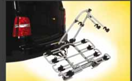
multi-cargo2-family für 4 Fahrräder Bestell.-Nr. 8400 (bestehend aus 8200, 8333, 8444)