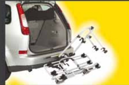
multi-cargo2-family für 3 Fahrräder Bestell.-Nr. 8300 (bestehend aus 8200 und 8333). Erweiterbar für 4 Fahrräder mit Bestell-Nr. 8444