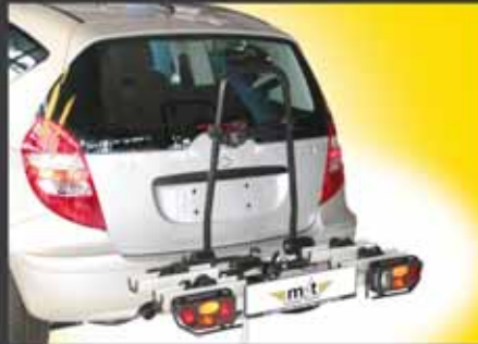
aluline smiley für 2 Fahrräder Bestell.-Nr. 6.200