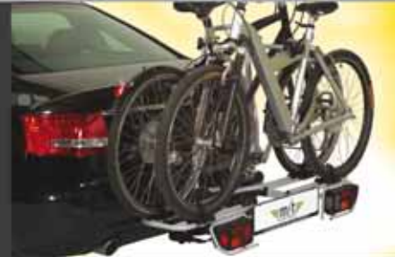
multi-cargo2-family für 2 Fahrräder Bestell.-Nr. 8200. Erweiterbar für 3 und 4 Fahrräder mit Bestell-Nr. 8333 und 8444