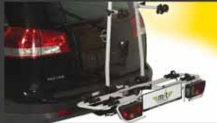
multi-cargo2-family Bestell.-Nr. 8200