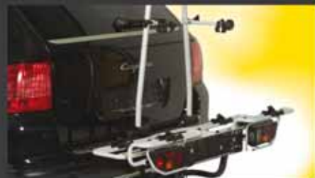
multi-cargo2-x-country Bestell.-Nr. 7200