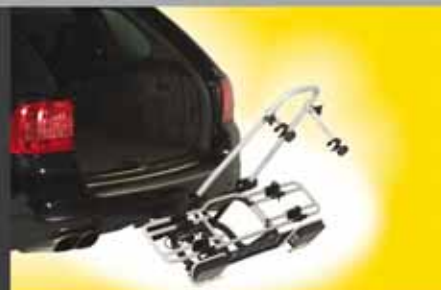
multi-cargo2-x-country für 2 Fahrräder Bestell.-Nr. 7200. Erweiterbar für 3 Fahrräder mit Bestell.-Nr. 8333