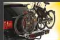
multi-cargo2-x-country Speziell für Fahrzeuge mit hochliegenden Auspuff- Endrohren durch das stabile und höher angebrachte Tragemodul. Heiße Abgase fließen unter dem Träger ab.