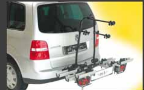
aluline smiley Passend für alle Fahrzeuge